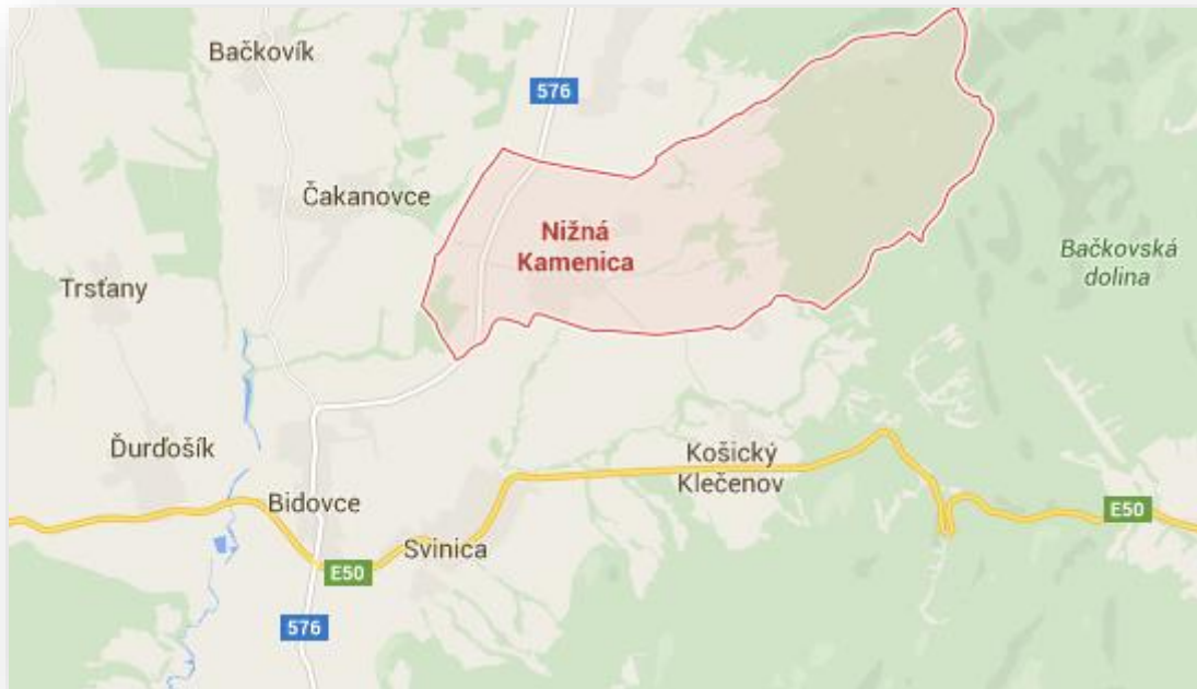
Grafické znázornenie polohy obce Nižná Kamenica

Katastrálne územie obce Nižná Kamenica sa rozprestiera v Košickom samosprávnom kraji. Nižná Kamenica a ďalšie obce - Čakanovce, Svinica, Herľany, Košický Klečenov, Vyšná Kamenica sú združené v mikroregióne Pod Mošnikom. Nachádzajú sa vo východnej časti okresu Košice – okolie. Od krajského mesta Košice je obec vzdialená približne 22 km. Zaujímavé územie obce má rozlohu 1 332 ha. Povrch je členitý, smerom na východ prechádza do podhoria Slanských vrchov. Východná časť je zalesnená. Cez obec Nižná Kamenica preteká Svinický potok.