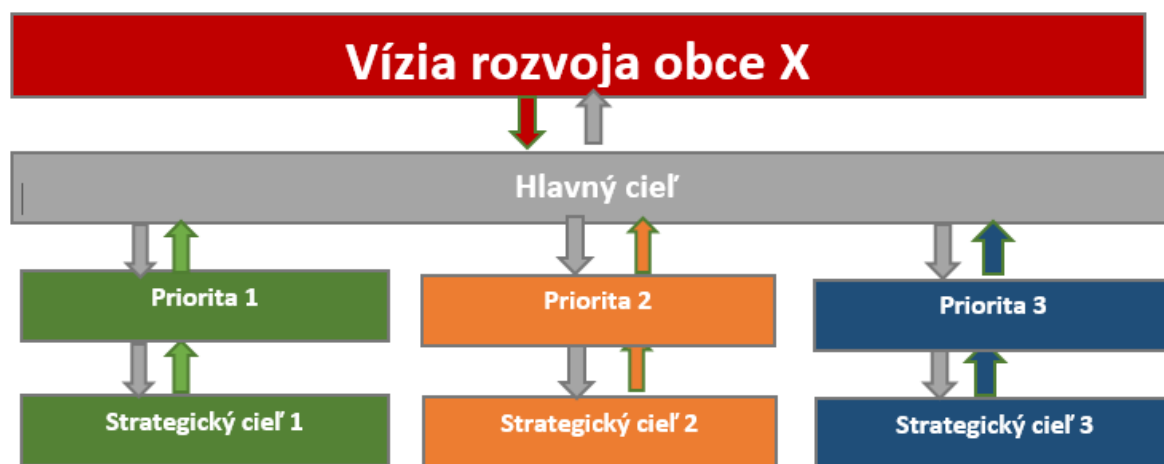
Obr. Prepojenie a väzby medzi definovaním Vízie rozvoja, Hlavného cieľa a priorít obce Nižná Kamenica